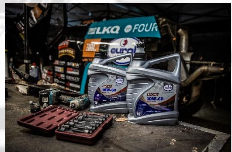
10W-60 in het bivak