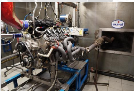
Motordyno bij APP Racing