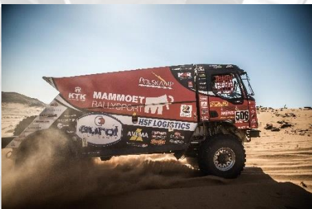
Mammoet Rallysport Team