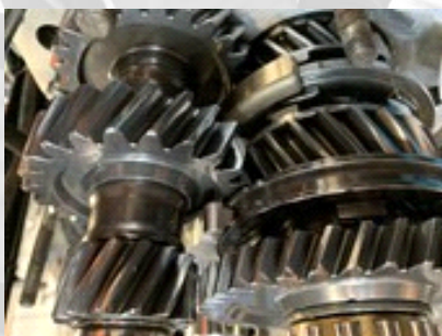
Close-up ingaande/uitgaande as