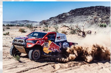
Nasser Al-Attiyah, GAZOO 2021

This sheet contains recommendations or suggestions on properties and possible applications of Eurol products. Because of continuous product research and development, the information in this document can be changed at all times, without foregoing notice. The analytical information in this document consists of typical incorrectness of the text. The reader is advised to make the final product choice in dialogue with the supplier.