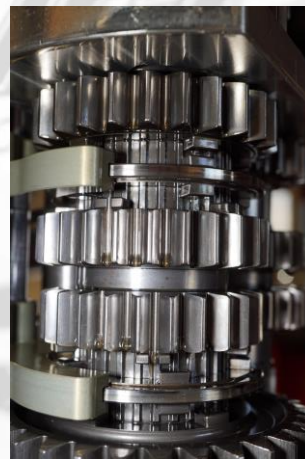
Close-up van versnellingen

This sheet contains recommendations or suggestions on properties and possible applications of Eurol products. Because of continuous product research and development, the information in this document can be changed at all times, without foregoing notice. The analytical information in this document consists of typical incorrectness of the text. The reader is advised to make the final product choice in dialogue with the supplier.