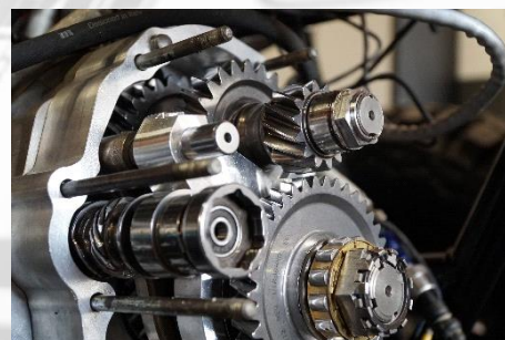
Close-up van versnellingsbak

This sheet contains recommendations or suggestions on properties and possible applications of Eurol products. Because of continuous product research and development, the information in this document can be changed at all times, without foregoing notice. The analytical information in this document consists of typical incorrectness of the text. The reader is advised to make the final product choice in dialogue with the supplier.