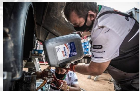
Het vullen van de naafreductie

This sheet contains recommendations or suggestions on properties and possible applications of Eurol products. Because of continuous product research and development, the information in this document can be changed at all times, without foregoing notice. The analytical information in this document consists of typical incorrectness of the text. The reader is advised to make the final product choice in dialogue with the supplier.