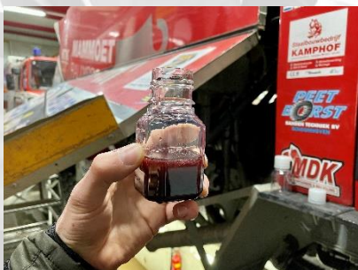
Monster na de Dakar Rally